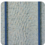
Gofrado o veteado

El instalador no es responsable de esas mínimas irregularidades, las cuales no se considerarán –en ningún caso– motivo de devolución de la lona.